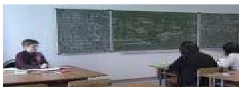
駐俄羅斯代表處文化組

俄羅斯教育科學部新聞處於星期四宣布，國家研究型大學競賽結果出爐，有 12 所大學獲獎。而俄羅斯大學雙龍頭：國立莫斯科大學及國立聖彼得堡大學早已在決賽前脫穎而出。